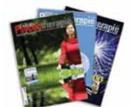
VFP-Mitgliedermagazine: „Paracelsus“ und „Freie Psychotherapie“